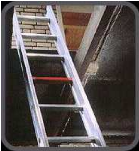
Ladders / trappen