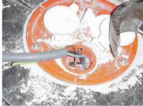
Kabelhaspels (dus niet zo)